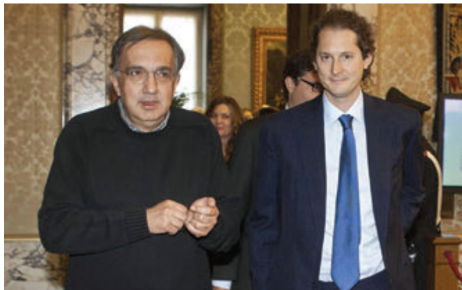
Sergio Marchionne con il Presidente della Fiat Chrysler Auto (Fca) John Elkann.

Per questo ora è indispensabile dare continuità alle scelte dell'azienda ed utilizzare le risorse prodotte per completare gli investimenti e spingere sull'offerta di modelli con motorizzazioni ibride, elettriche ed anche sulla